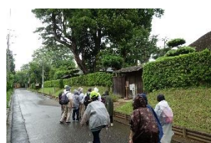
B1 武家屋敷通りにて