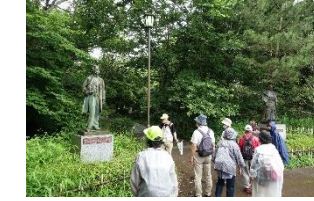
B1 ハリスと堀田正睦像