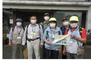
A2 おはやし館前にて