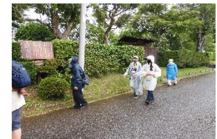
B2 武家屋敷通りにて