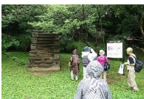
B1 訓練用 12 階段前にて