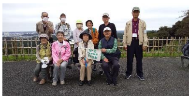
B2 昭和の森 展望台にて