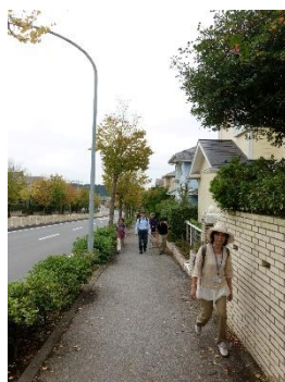
A1 もうすぐゴール 公園通り坂道