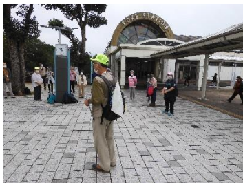
出発前ミーティングと新会員紹介