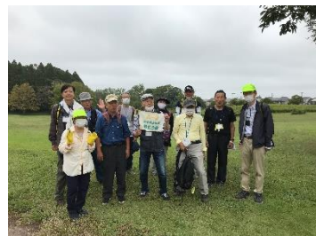
A2 昭和の森 園内にて