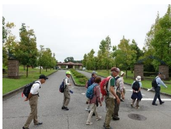
A1 高級住宅地入口前