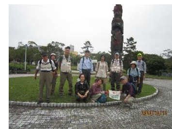
A1 ふれあいの広場公園にて