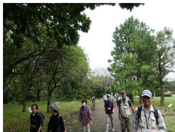
A1 昭和の森 園内を行く