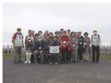
B1 昭和の森 展望台にて