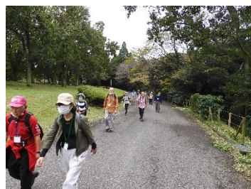
B1 昭和の森 園内を行く