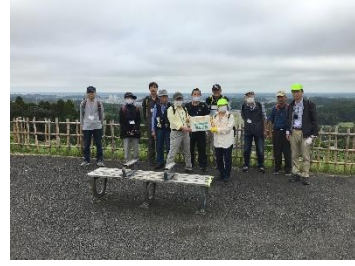
A2 昭和の森 展望台にて