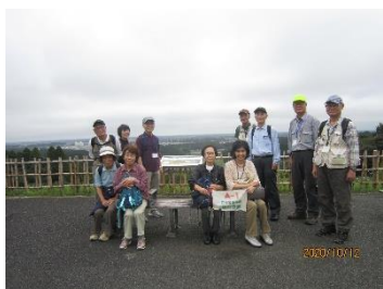
A1 昭和の森 展望台にて