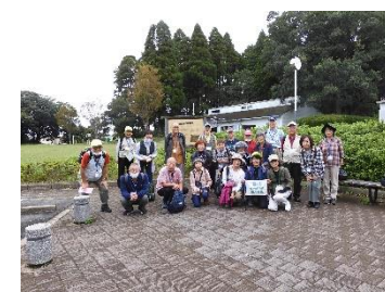
B1 萩生道遺跡前にて