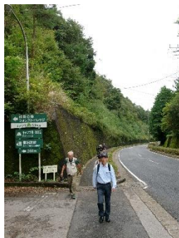
A1 園出口からの急坂