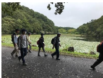
A2 昭和の森 下夕田池を行く